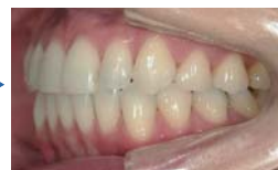
【側方】噛み合わせも改善