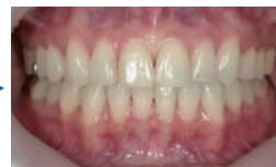
【正面】歯並びの改善